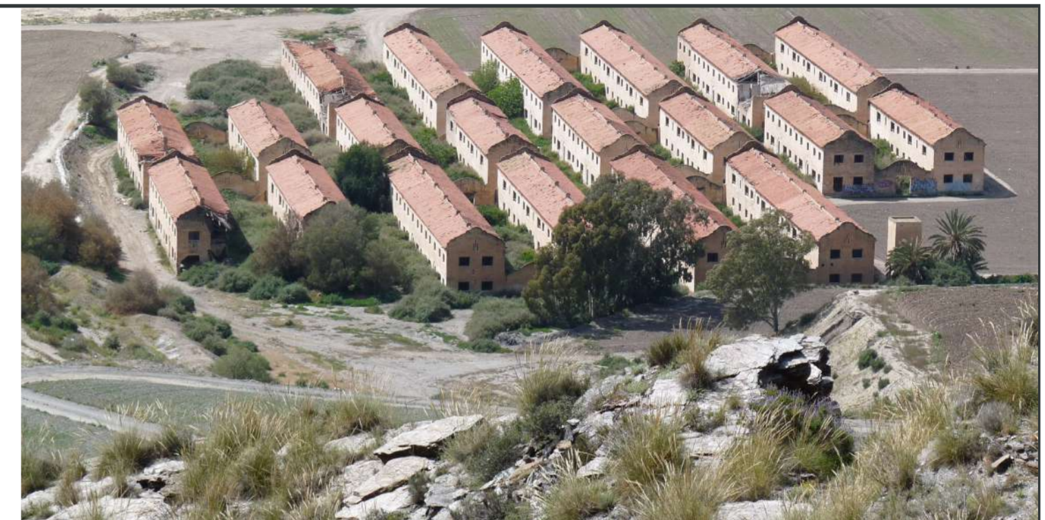
Poblado Minero de El Arteal.

Pero mientras aquel intento duró, se vivió una época de relativa y aparente prosperidad que nunca justificó ni amortizó la inversión realizada y de la que sólo queda la huella decrepita y fantasmal de lo que ahora nos parece una quimera: el poblado minero de El Arteal, popular y peyorativamente conocido como “Corea”. Debido a que la actividad minera requería abundante mano de obra especializada y no había suficiente en Cuevas ni en los municipios colindantes, hubo que reclutar obreros en otros distritos mineros. Para ello había que proporcionarles viviendas